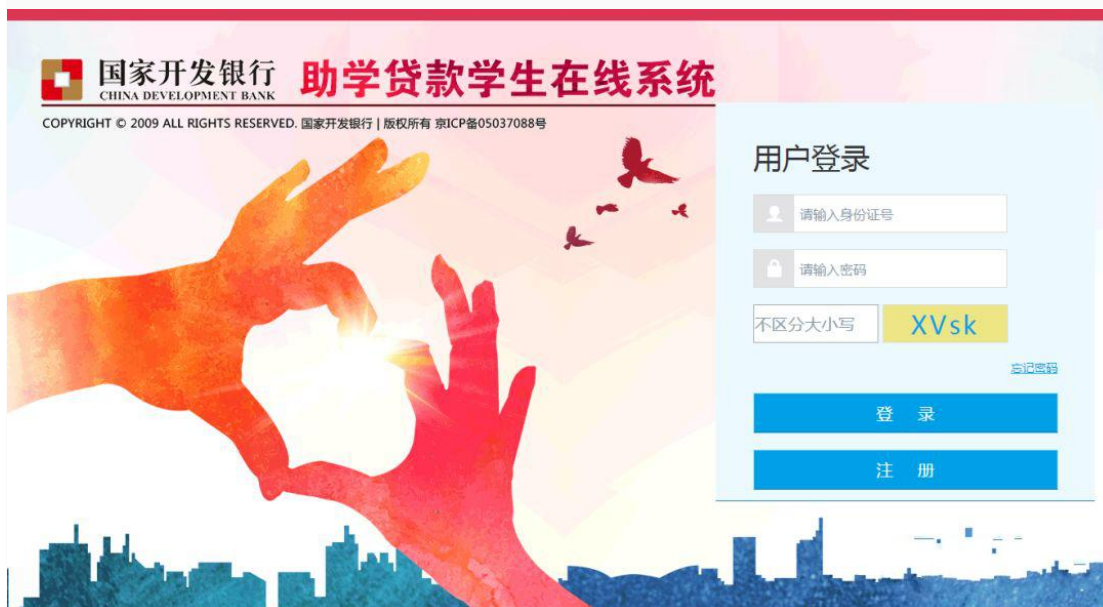
△学生在线服务系统登录界面

1. 登陆 https://s1s.cdb.com.cn , 点击“注册”, 弹出注册用户协议条款, 阅读后点击“同意”