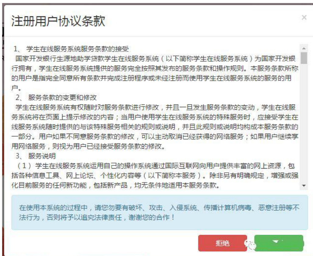
△学生在线服务系统新用户注册协议界面