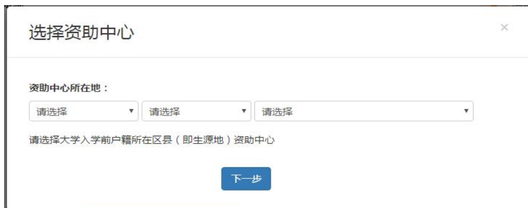
△学生在线服务系统新用户完善信息选择资助中心

5. 在弹出选择资助中心窗口内，选择大学入学前户籍所在区县级生源地资助中心，然后点击“下一步”