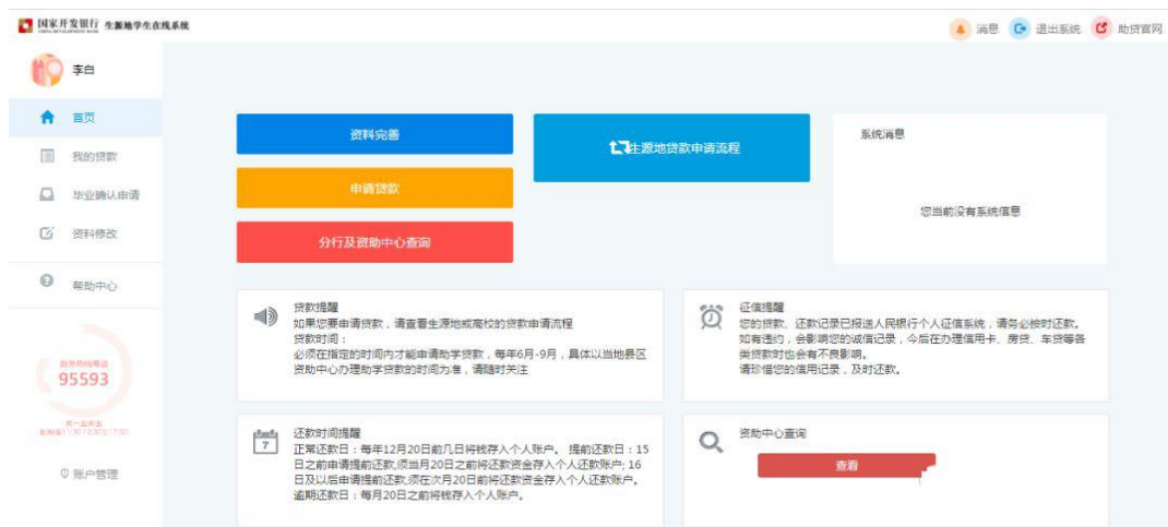
△学生在线服务系统新用户登录后界面

4. 也可以在助贷网站登录页输入身份证号、密码、验证码，点击登录按钮，登陆系统后，点击“资料完善”